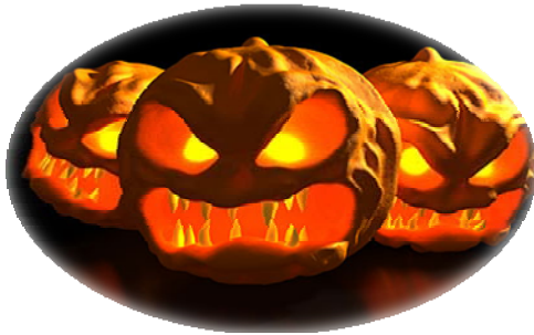
Rysunek 1 http://obrazeczkiniki.blog.pl/id,3867387,title,halloween-

Halloween jest obchodzone nocą 31 października, czyli w przeddzień Wszystkich Świętych. Związane jest z maskaradą i odnosi się ono do święta zmarłych. Najhuczniej obchodzone jest w Stanach Zjednoczonych, Irlandii, Kanadzie i Wielkiej Brytanii.