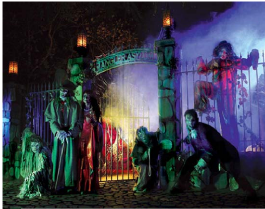
Rysunek 3 ntertainmentdesigner.com/news/theme-park-design-news/best-theme-park-attractions-for-halloween-2012/

W Polsce Halloween stało się popularne w latach 90-tych. Młodzież przebiera się w straszne stroje i organizuje imprezy. Najpopularniejszą zabawą jest